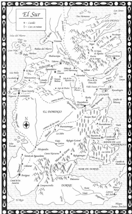
Mapa: James Sinclair